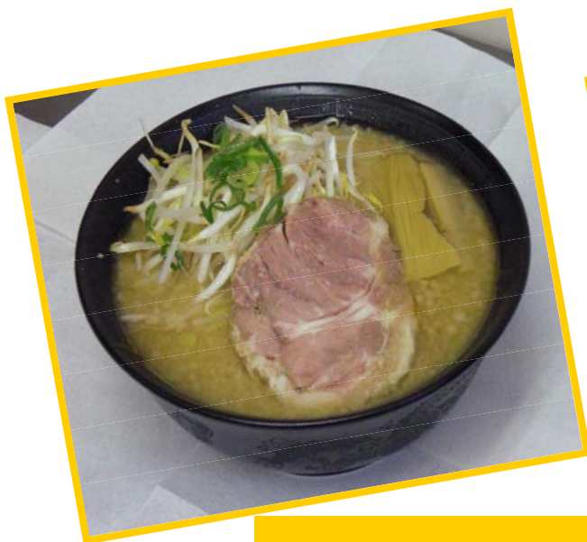
↑こちらのラーメンです