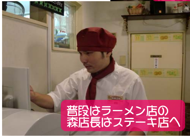
普段はラーメン店の 森店長はステーキ店へ